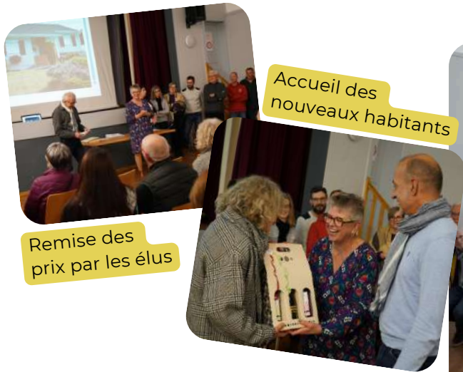
Accueil des nouveaux habitants