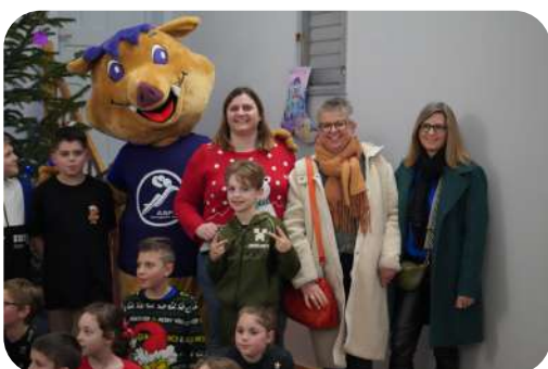
Arbre de Noël de l'AS Handball