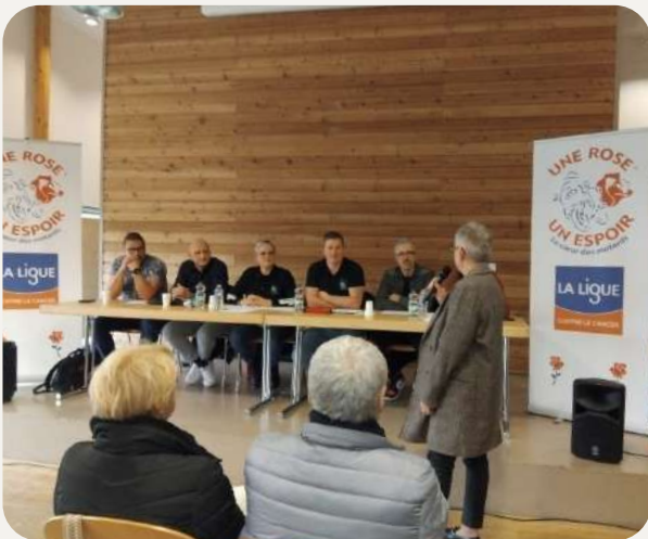
Mme le Maire a pris la parole pour féliciter les bénévoles pour leur engagement exemplaire, ayant permis de récolter 38 500 € en faveur de la "Ligue contre le cancer"