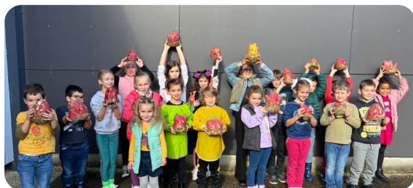
Atelier Romelbotzen dans le cadre de Bêtes et Sorcières

1 fois par mois, les enfants atteints de troubles du spectre autistique viennent pour des moments adaptés qui éveillent leur plaisir et leur créativité.