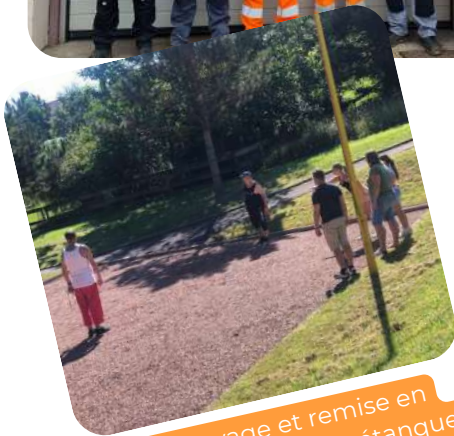
Nettoyage et remise en état du terrain de pétanque