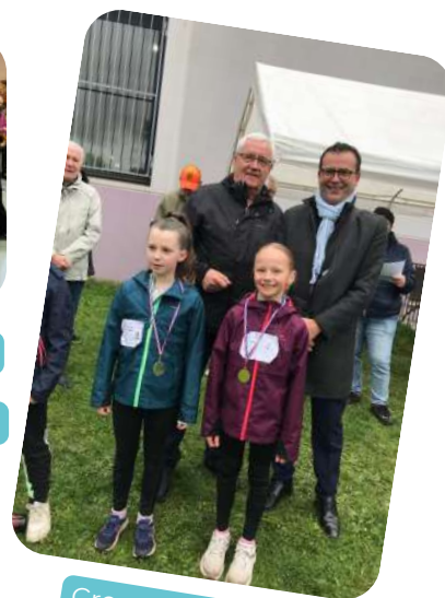
Cross de l'USEP