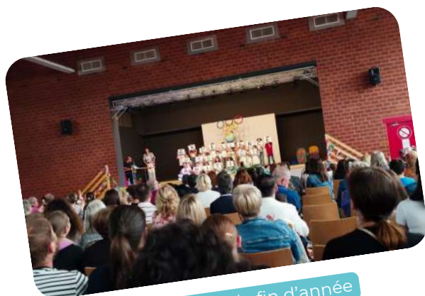
Kermesse de fin d'année