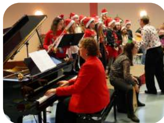
Participation des CM2 au concert de Noël de l'Harmonie Municipale

Cette année, l'école a accueilli 178 élèves répartis en 8 classes. Le cross de l'USEP, la kermesse et les activités inspirées des Jeux Olympiques ont rythmé l'année. La municipalité a soutenu les élèves avec des livres pour les CP et des ordinateurs pour les enseignants. L'association des parents d'élèves et des partenariats, comme avec l'Espace Culturel Sainte-Barbe, ont enrichi la vie scolaire. 2024 a été marquée par dynamisme et projets éducatifs variés.