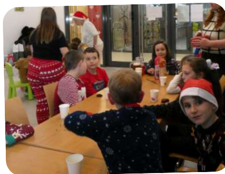
Activités autour de Noël à l'Espace Culturel