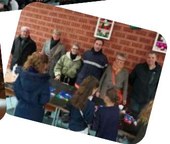
Accueillie par les sapeurs-pompiers de Porcelette, la caravane de l'espoir de l'UDSP 57 a permis de soutenir le Téléthon et de récolter 500€ grâce à une collecte de piles usagées et à la vente de porte-clés, mobilisant le village pour cette belle cause.