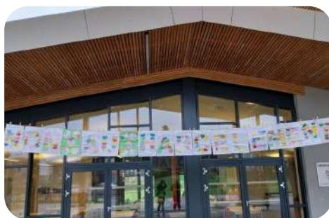
Participation à la journée contre le harcèlement