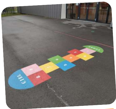
Nouveau jeu au sol pour la cour du groupe scolaire