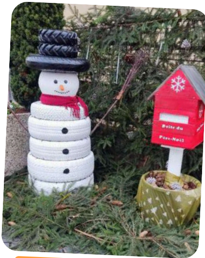
Création des décorations de Noël pour la ville