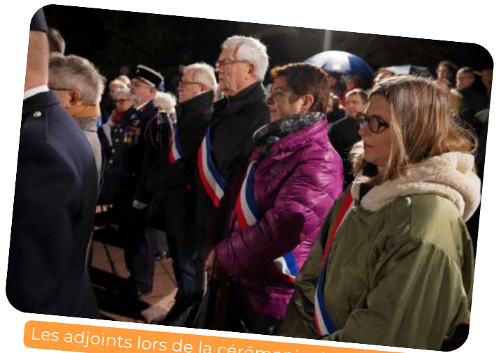
Les adjoints lors de la cérémonie du 27 novembre