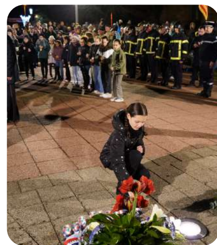
Participation à la cérémonie du 27 novembre