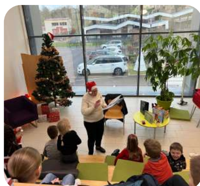
Heure du conte de Noël