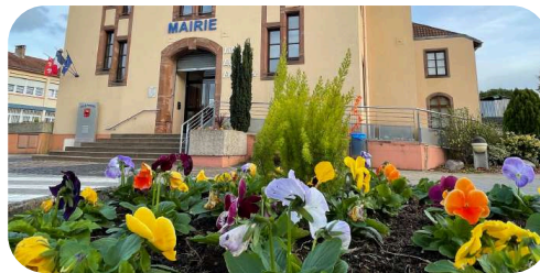
Fleurissement du village

Les services techniques de Porcellette sont présents à chaque coin de rue, mais leur travail va bien au-delà de ce que l'on voit au quotidien. Qu'il pleuve, neige ou brille, ils s'efforcent de maintenir notre village en parfait état : entretien des espaces verts, réparations, gestion des infrastructures... Malgré leur dévouement, il est impossible d'être partout à la fois, et parfois certains travaux prennent un peu plus de temps. Nous vous remercions pour votre compréhension et vous invitons à apprécier le travail invisible mais essentiel qu'ils accomplissent chaque jour.