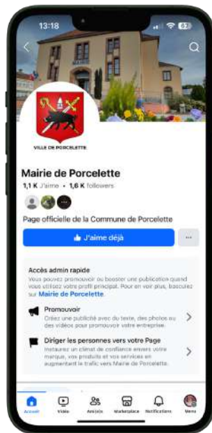
Facebook : Mairie de Porcelette