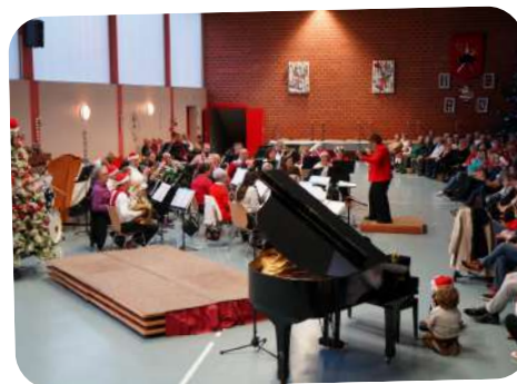
Concert de Noël de l'Harmonie Municipale