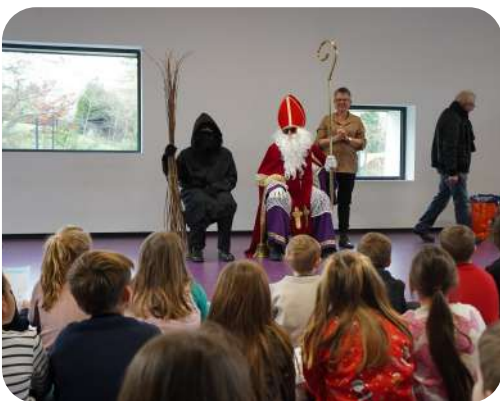
Visite du Saint-Nicolas, du Père Fouettard et de la Municipalité à l'école