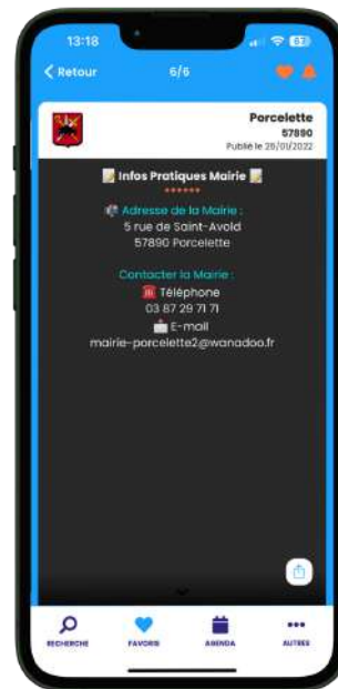
Panneau pocket : Porcelette