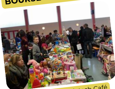
Organisé par le Klatsch Café