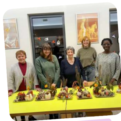
Atelier créatif adulte