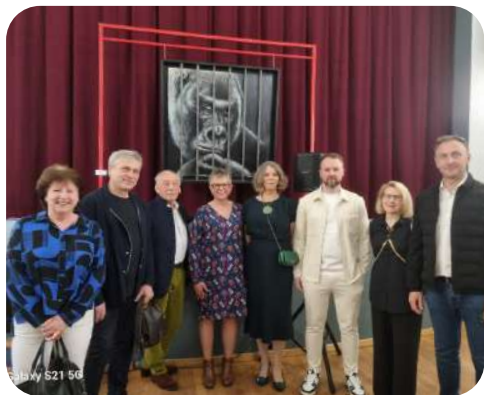
Inauguration de l'exposition de l'association Plastica Naboria