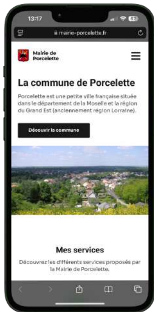
Site internet : www.mairie-porcelette.fr

RESTEZ CONNECTÉ POUR NE RIEN MANQUER DES DERNIÈRES ACTUALITÉS