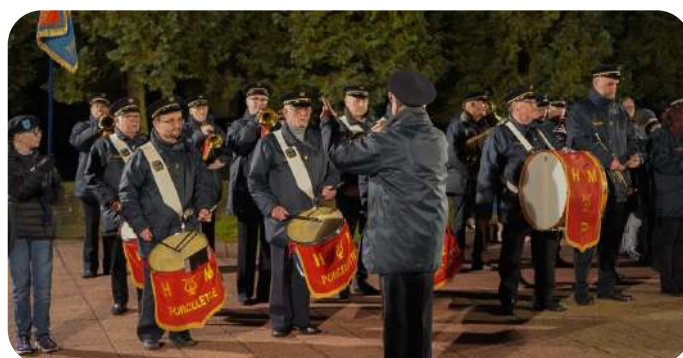
L'harmonie Municipale lors de la cérémonie du 27 novembre