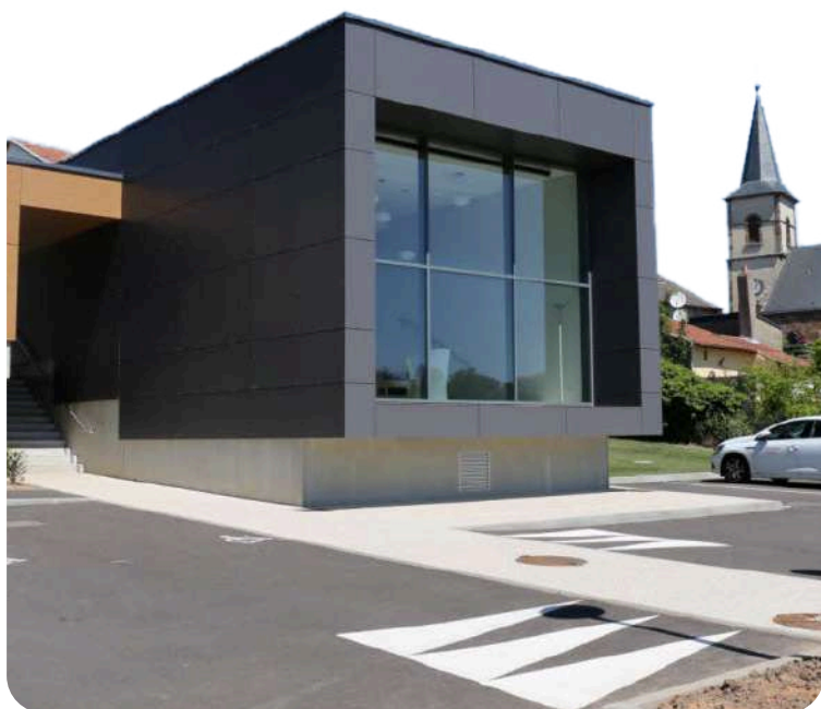
L'espace culturel situé 14 rue de Boucheporn, Porcellette