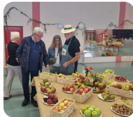
Visite de l'exposition fruitière organisée par l'association des arboriculteurs