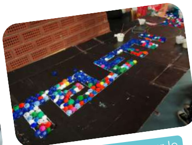
Atelier créatif pour le téléthon