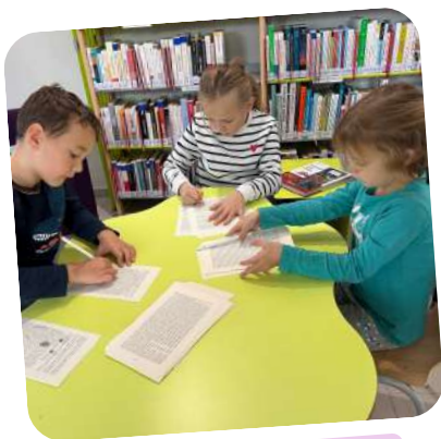
Atelier créatif enfant