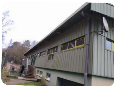
Remplacement de la gouttière de la tribune du foot