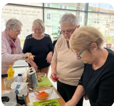
Atelier cuisine anti-gaspi

La municipalité tient à remercier chaleureusement les bénévoles de l'Espace Culturel Sainte-Barbe. C'est grâce à leur engagement, leur passion et leur dévouement que la bibliothèque peut offrir un accueil de qualité, des animations variées et un accès facilité à la culture pour tous. Leur contribution est essentielle au dynamisme de cet espace si précieux pour notre commune. Merci à eux !