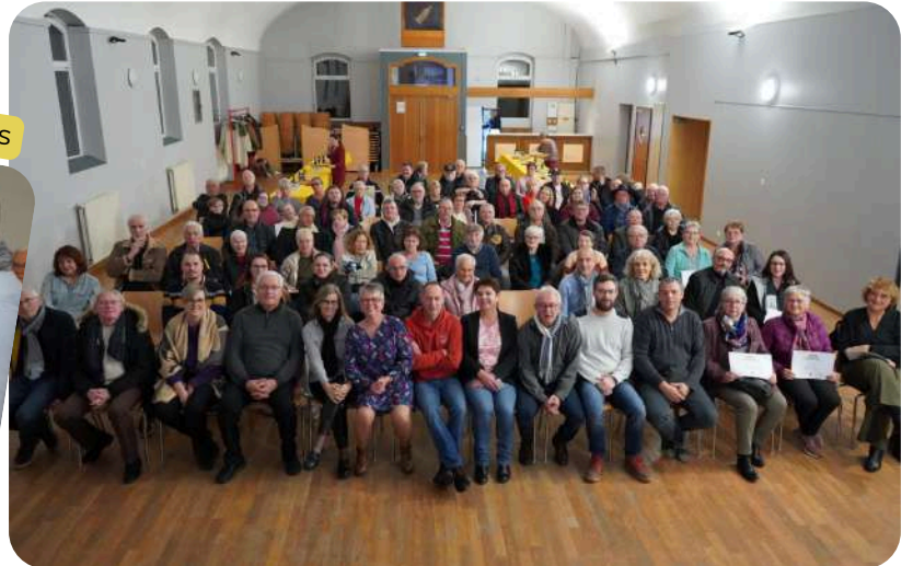
Les participants et le jury du concours des maisons fleuries