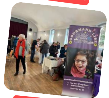
Marché de Noël au bénéfice de l'association Gourmand'ise