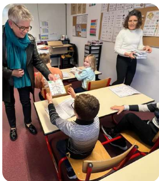
Distribution de livres offerts par la municipalité pour fêter l'entrée en primaire des CP