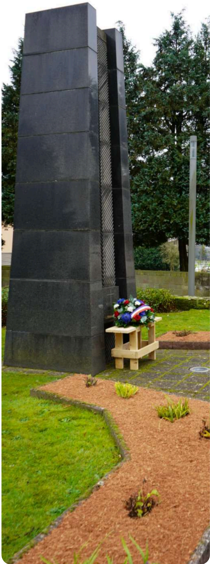
Le monument aux morts