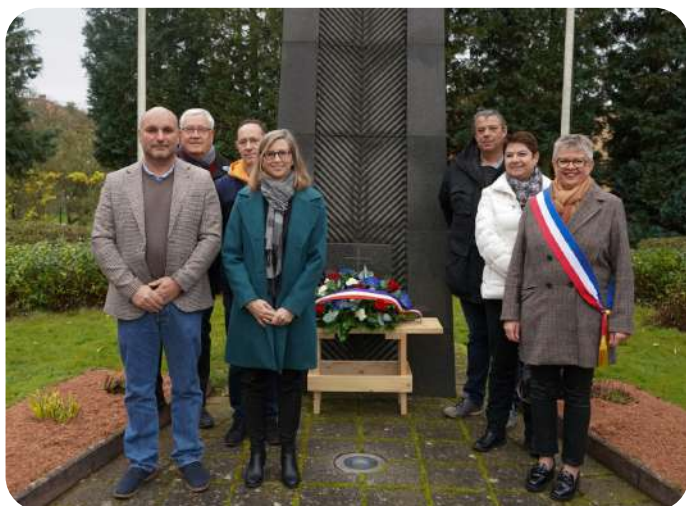
Le conseil municipal en la cérémonie du 11 novembre