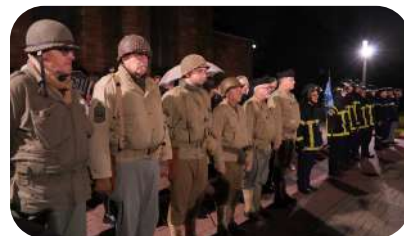
Les pompiers et l'ASFA présents à chacune des cérémonies