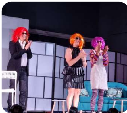
La troupe de Fantaisie Théâtre, qui a présenté la pièce "Bonne Année Anémone"