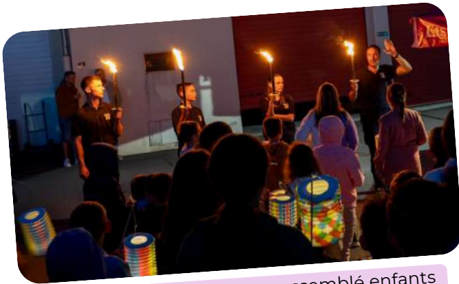
La retraite aux flambeaux a rassemblé enfants et pompiers dans un moment chaleureux !