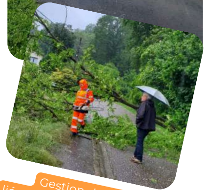
Gestion des dégâts liés aux intempéries, avec mise en sécurité par nos agents et en présence d'élus