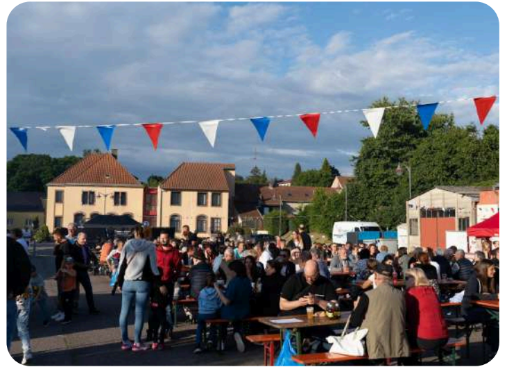
La place de la Mairie, parée de bleu, blanc, rouge, a accueilli une foule venue célébrer la Fête Nationale dans une ambiance festive