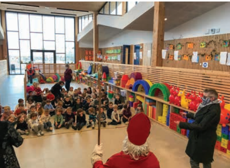
Visite du Saint-Nicolas à l'école.