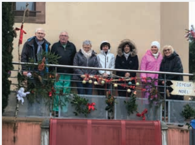
Les membres du Conseil des Seniors ont bravé la pluie pour mettre en place une jolie décoration de Noël devant la mairie. Un grand merci à eux pour leur participation.