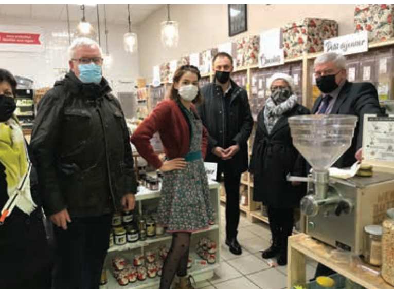
Visite des élus à l'occasion du 1 er anniversaire de l'enseigne Parent'Vrac.